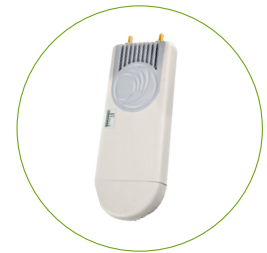
Радиомодуль синхронизации по GPS ePMP 1000 GPS Sync Radio