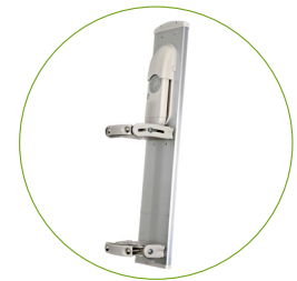
Радиомодуль ePMP 1000 GPS Sync Radio с секторной антенной